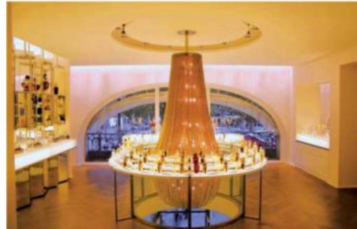
Boutique Guerlain à Paris