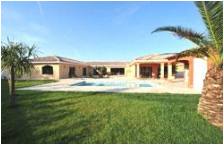
Maison Domotique adaptée au handicap