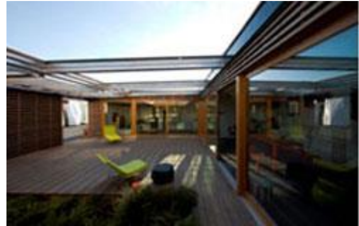
Maison "Construisons demain"