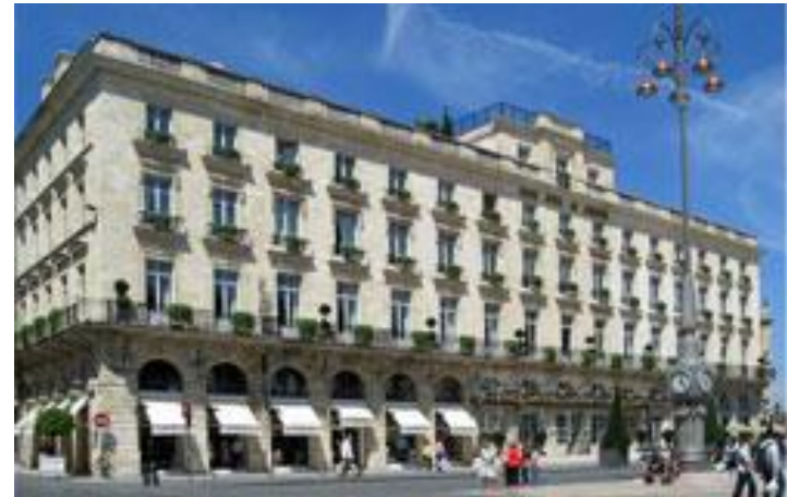
Grand Hôtel - Bordeaux