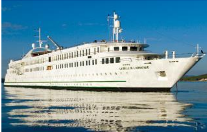
Bateau "La Belle Adriatique"