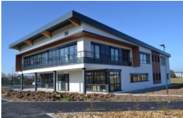
Pôle emploi Diguoin