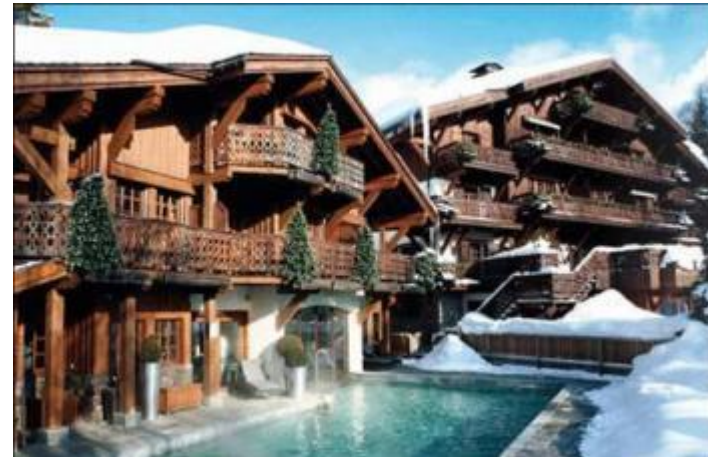
Hôtel Arboisie - Megève